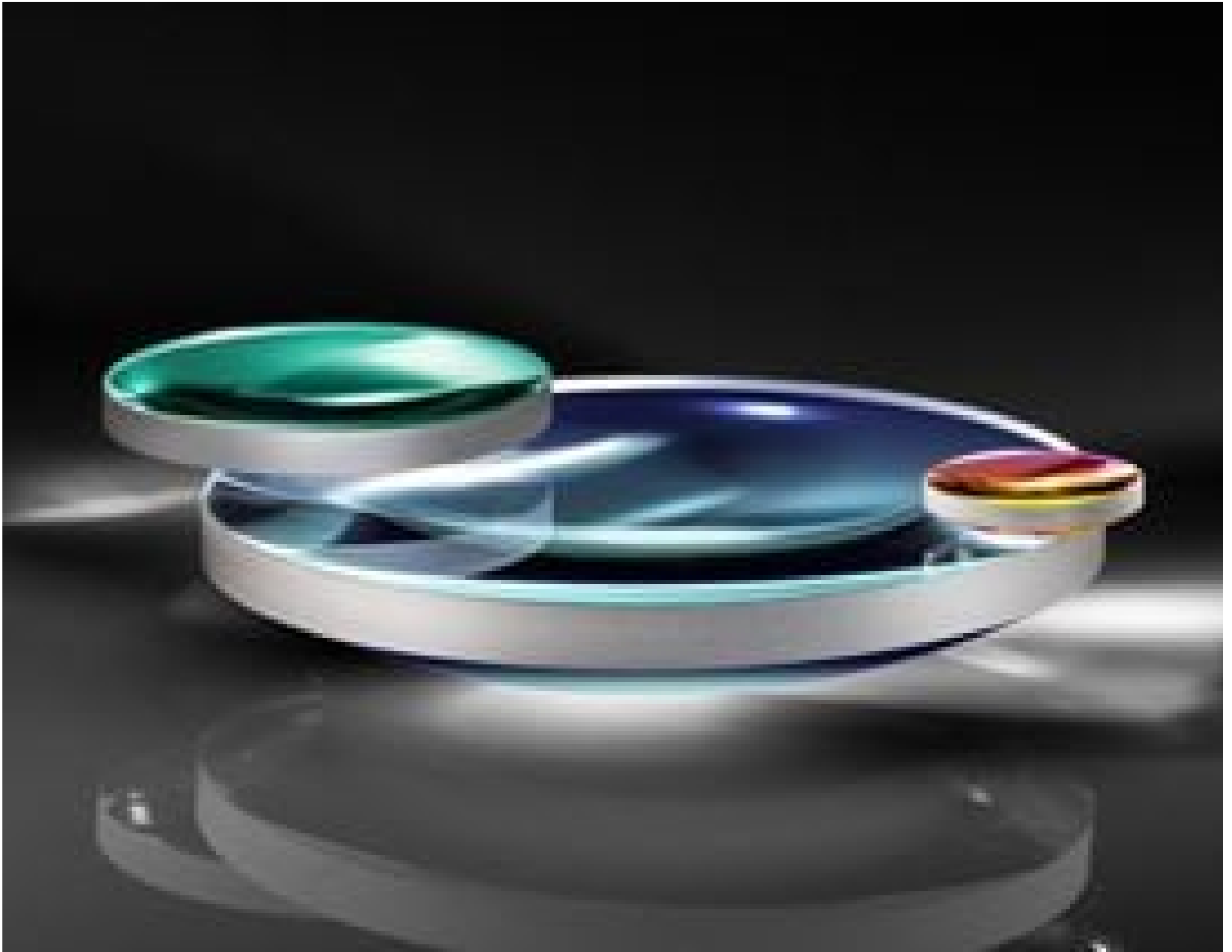
633nm Laser Line Coated Plano-Convex (PCX) Lenses