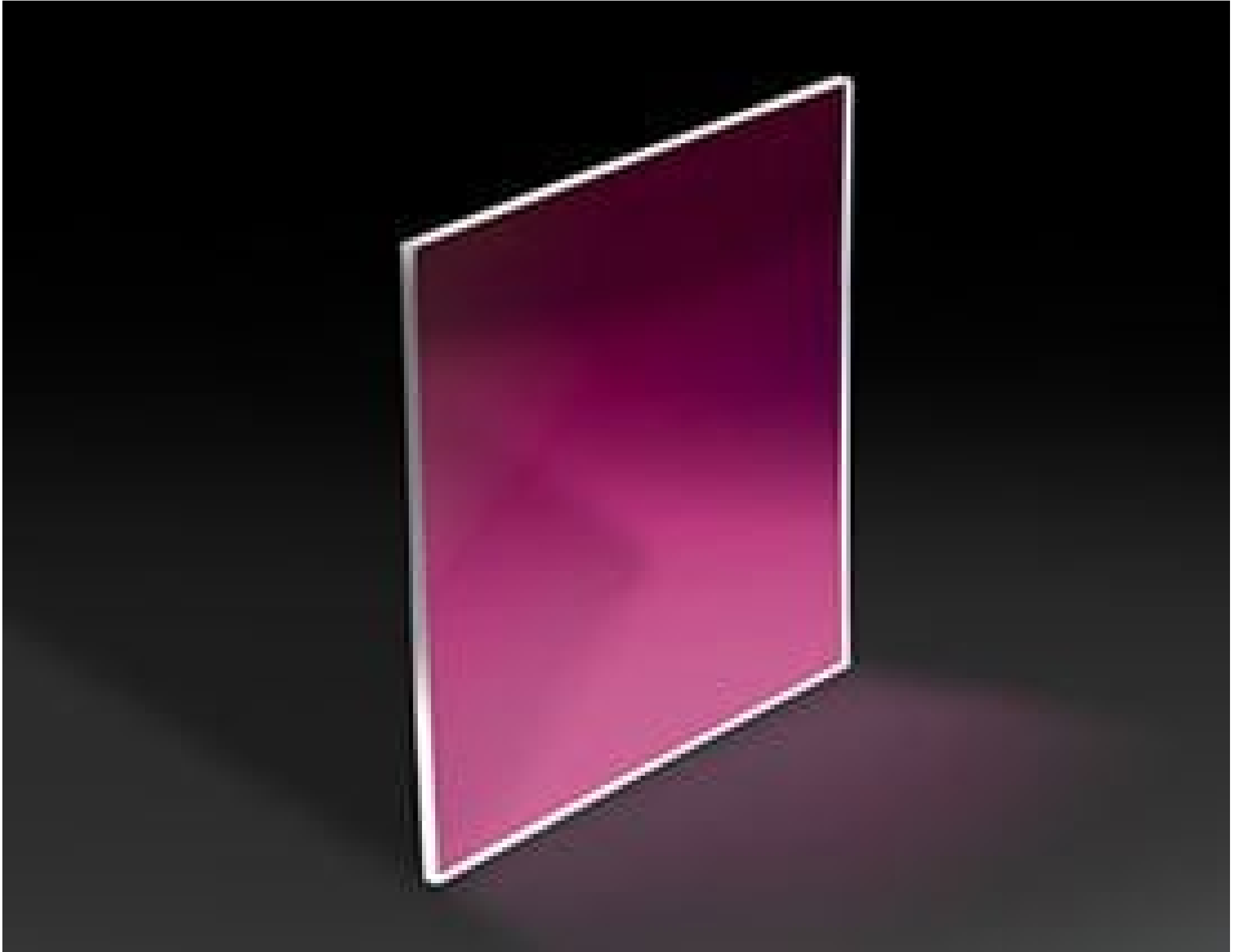
Gorilla® Glass Windows