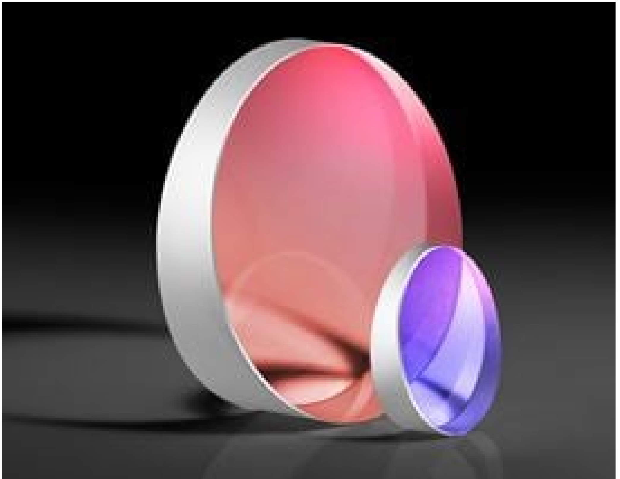
TECHSPEC Fused Silica Wedge Prisms