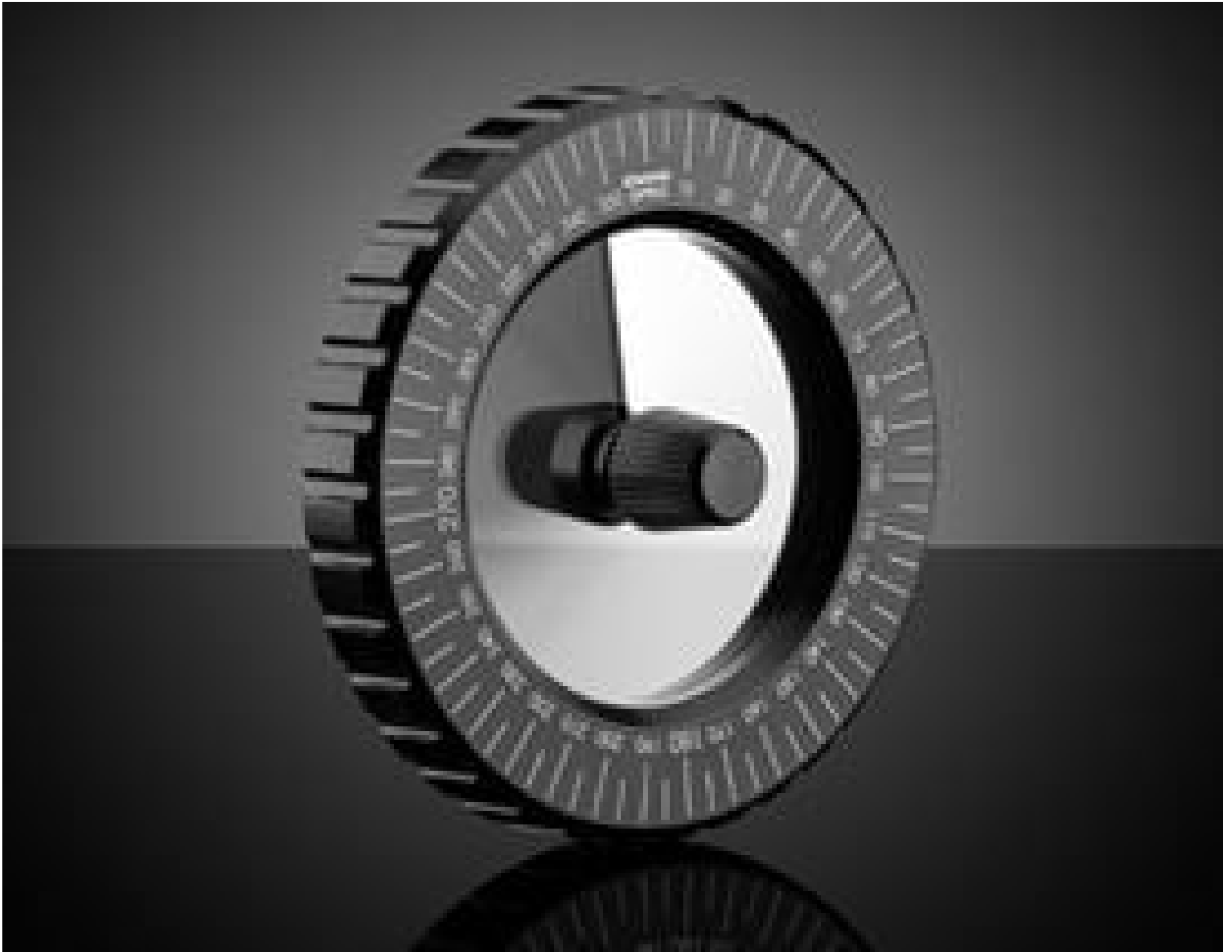
Mounted Circular Variable Neutral Density (ND) Filters